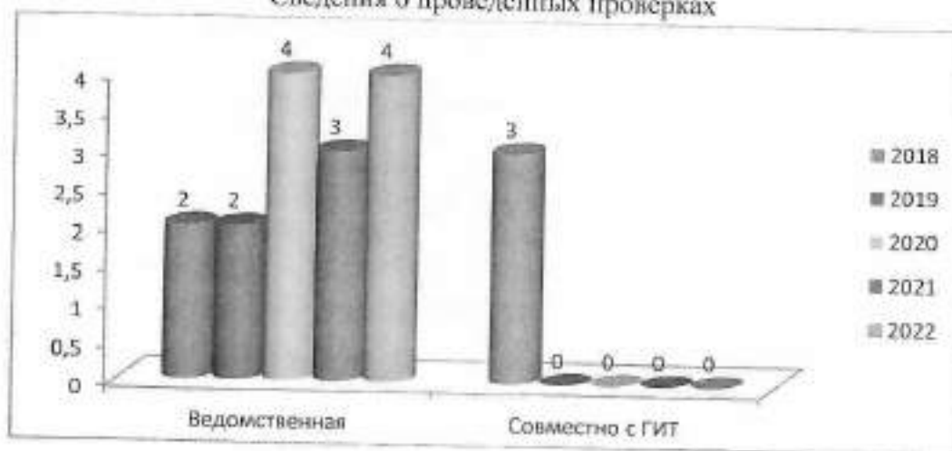
Сведения о проведенных проверках

В 2022 году проверки с Государственной инспекцией труда Иркутской области не осуществлялись.