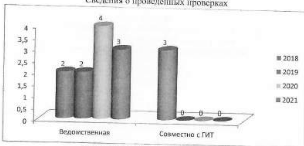
Количество выявленных нарушений